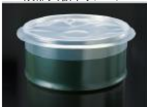
成形天板ポリシート