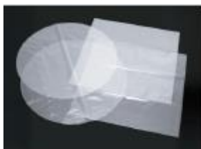
角形・円形天板ポリシート